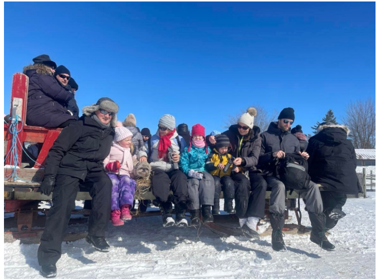
Polonia pielęgnuje polskie tradycje. Kulig Sokoła Saint Boniface w Parku Birds Hill